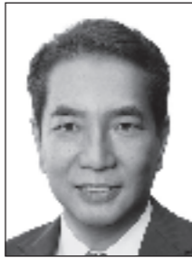
宮崎2区 江藤 拓