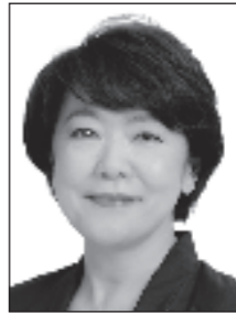
沖縄3区 島尻 あい子