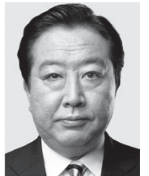
立憲民主党 代表 野田佳彦

7 共生社会 多様性を認め合える当たり前の社会 ●選択的夫婦別姓制度を実現 ●ジェンダー平等を着実に推進