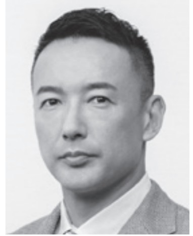
れいわ新選組 代表 山本太郎