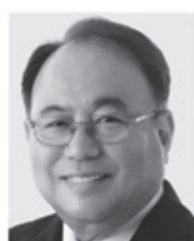
きんしや たおる 沖縄4区